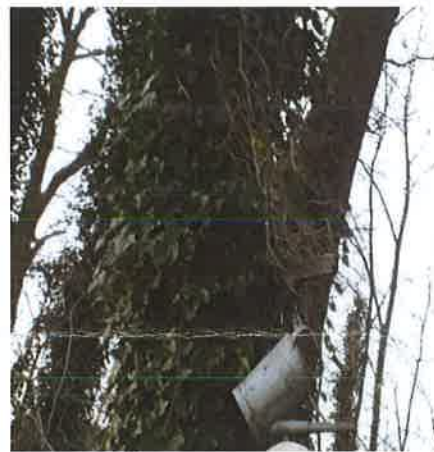
Antwoord: Brinkstukken bij Marja Koomen