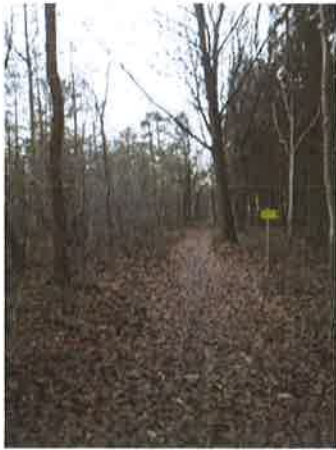
Antwoord: In de wacht